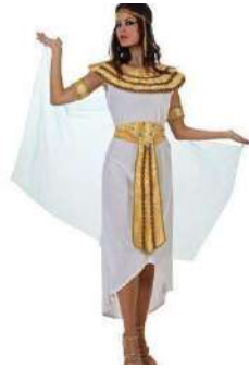
35-REINA DEL NILO