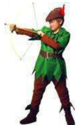
82-ARQUERO DE LOS BOSQUES