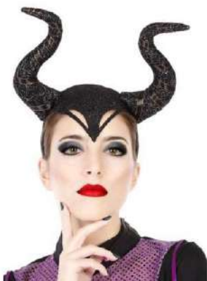
DIADEMA CUERNOS MALEFICA