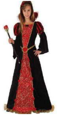
62-63-REINA DE CORAZONES