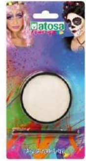
MAQUILLAJE AL AGUA