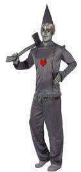
14-HOMBRE DE HOJALATA