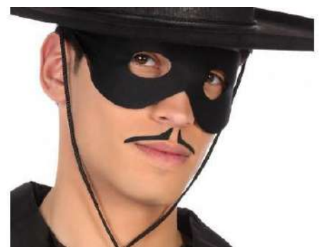
ANTIFAZ EL ZORRO