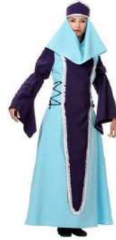
51-SANCHA DE CASTILLA