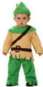
39-BEBÉ DE LOS BOSQUES