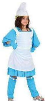
49--DUENDE AZUL NIÑA