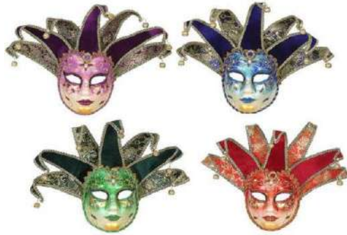
MASCARA VENECIA CASCABEL