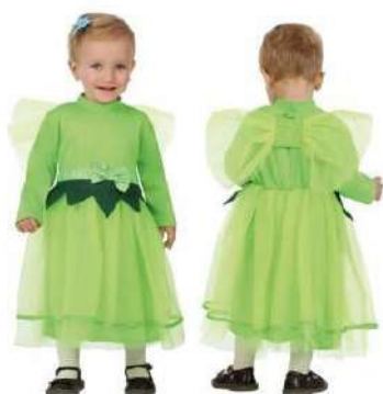
52-HADA VERDE BEBÉ