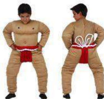
110-LUCHADOR DE SUMO