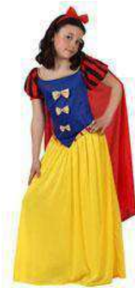
64-PRINCES DE LAS NIEVES