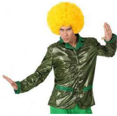
CHAQUETA DISCO VERDE