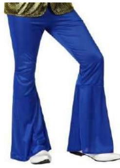
PANTALON DISCO AZUL