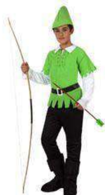
80-ARQUERO DE LOS BOSQUES