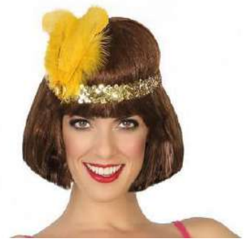
CINTA PELO DORADO