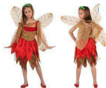
54-HADA OTOÑAL CON ALAS DOBLE