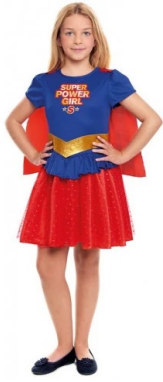
115 HEROINA NIÑA