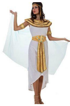
31-REINA DEL NILO