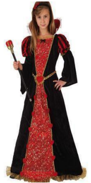
64-65-REINA DE CORAZONES