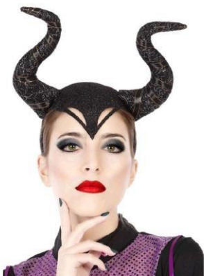
DIADEMA CUERNOS MALEFICA