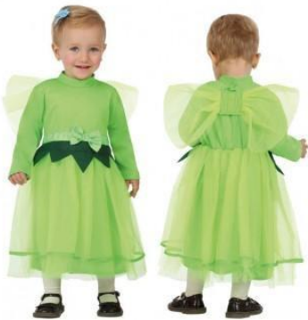
54-HADA VERDE BEBÉ