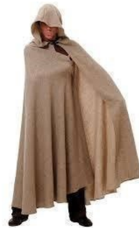
CAPA (OTROS COLORES)