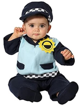
3-POLICIA LOCAL BEBE