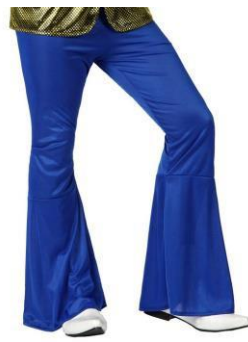
PANTALON DISCO AZUL