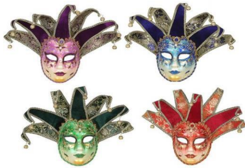
MASCARA VENECIA CASCABEL