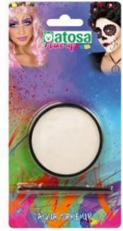
MAQUILLAJE AL AGUA