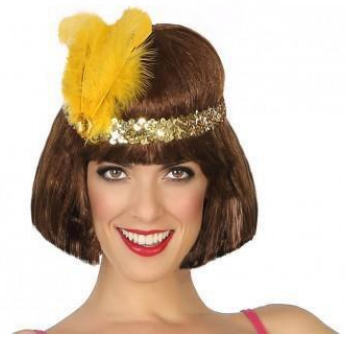
CINTA PELO DORADO