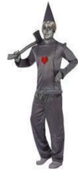
7-HOMBRE DE HOJALATA