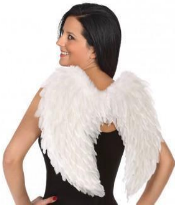
ALAS DE ANGEL