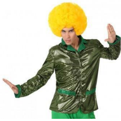
CHAQUETA DISCO VERDE