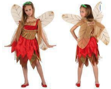
56-HADA OTOÑAL CON ALAS DOBLE