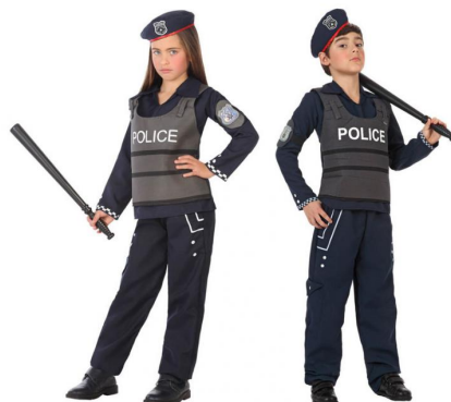
113-POLICIA LOCAL UNISEX NIÑO