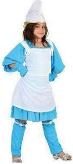
51-DUENDE AZUL NIÑA