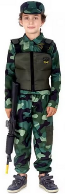
122- MILITAR NIÑO