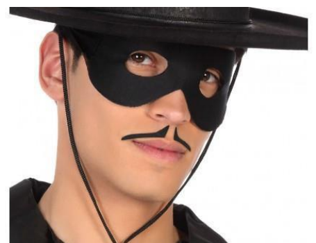
ANTIFAZ EL ZORRO