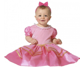
9-PRINCESA ROSA BEBE