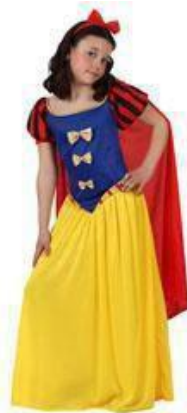
66-PRINCES DE LAS NIEVES